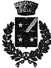
CAPRIANO DEL COLLE