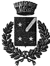
CAPRIANO DEL COLLE