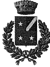
CAPRIANO DEL COLLE