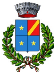
CAPRIANO DEL COLLE