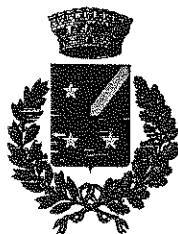
CAPRIANO DEL COLLE