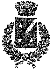
CAPRIANO DEL COLLE