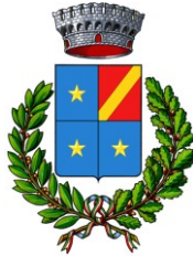
CAPRIANO DEL COLLE