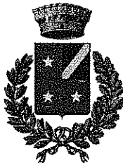
CAPRIANO DEL COLLE