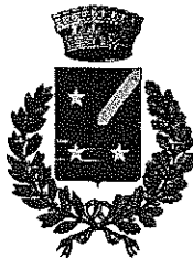
CAPRIANO DEL COLLE