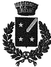
CAPRIANO DEL COLLE