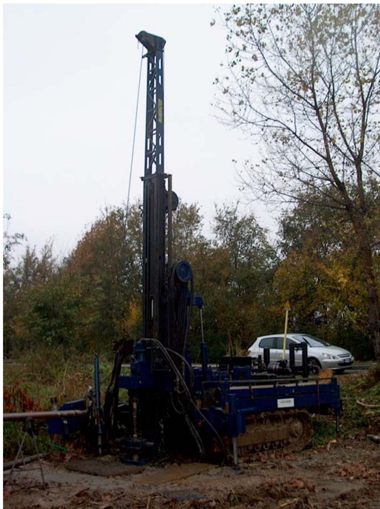
Foto 5: esecuzione sondaggio a carotaggio continuo (sullo sfondo, la S.P. n. 9 “Quinzanese”).