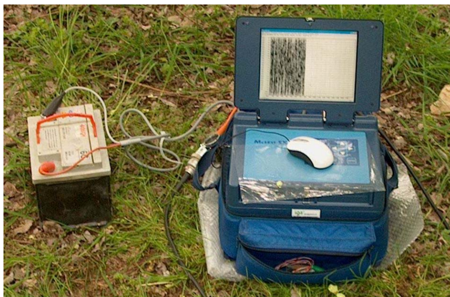
Foto 2: sismografo multicanale utilizzato durante l'esecuzione della prova geofisica.