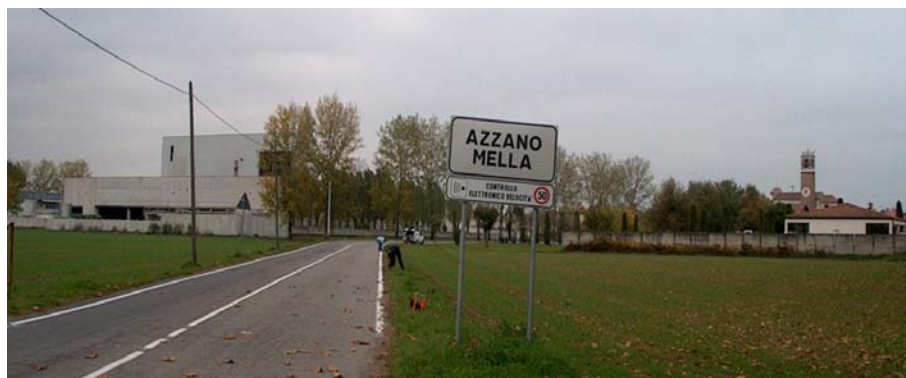
Foto 1: esecuzione prova geofisica – l'area è localizzata a sud del cimitero comunale, lungo la strada che collega l'abitato di Azzano (sullo sfondo) a C.na Masnina.