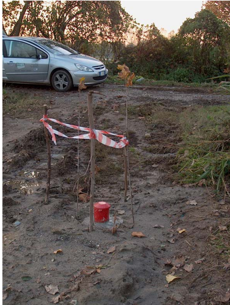
Foto 6: realizzazione piezometro, ca. 130 m a nord ovest di C.na Franciosa.