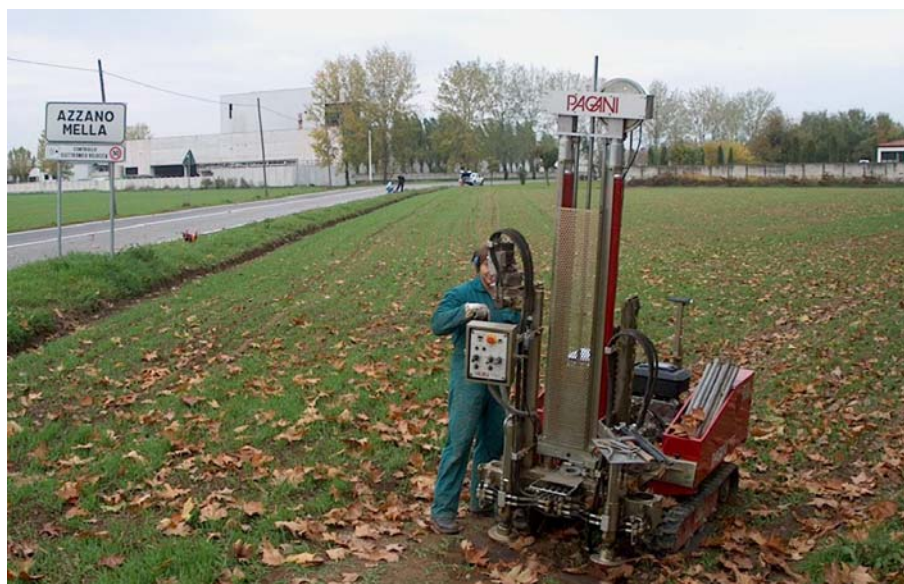
Foto 4: esecuzione prova penetrometrica dinamica SCPT in area adiacente al punto di indagine geofisica (sullo sfondo, il perimetro del muro di cinta del cimitero comunale).